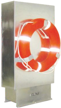
DLM.208-E model ARKA GÖRÜNÜM