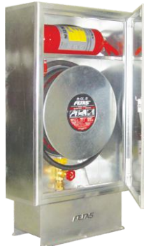
DLM.208-E model ÖN GÖRÜNÜM