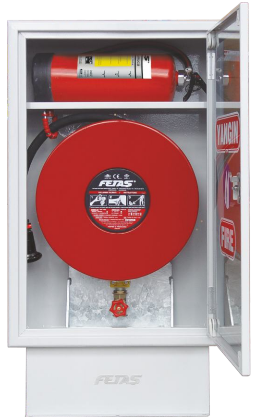
DLM.208-E model RAL 7047 cam kapak