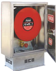
DLM.208 model ÖN GÖRÜNÜM