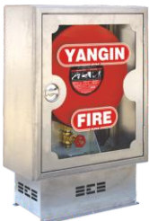
DLM.208 model ARKA GÖRÜNÜM